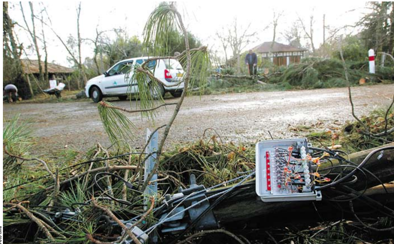
Klaus vyhrál. Nejnákladnější letošní přírodní katastrofou byla zimní bouře Klaus, která zasáhla Španělsko a Francii